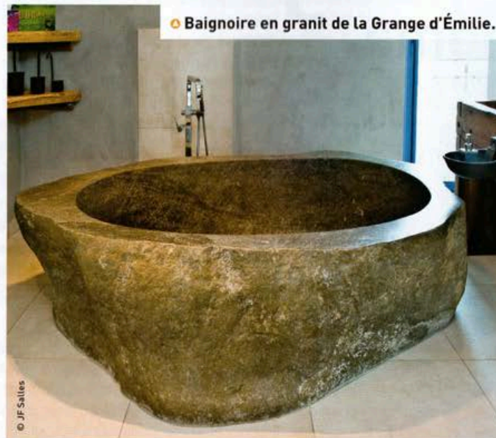
● Baignoire en granit de la Grange d'Émilie.